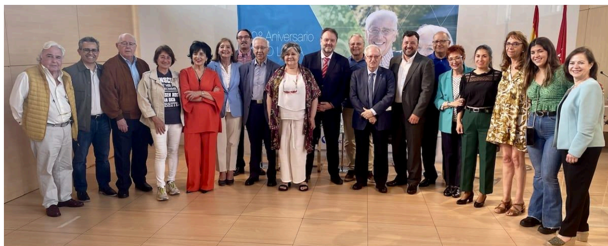
Foto de representantes del Foro LideA en el evento del 10 aniversario.